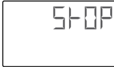
(1 Sek Übergangsblinken)